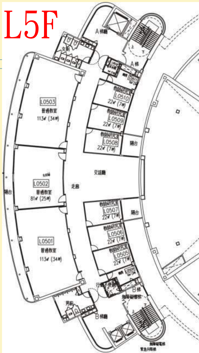
1 伍層平面圖 A2-09 Scale: 1/200